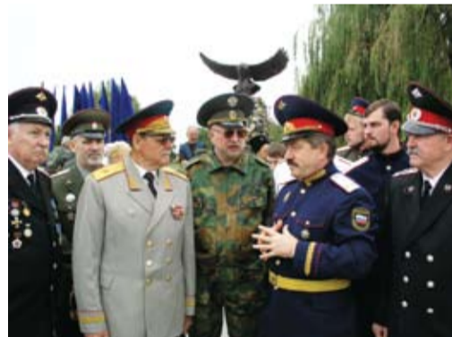
В.П. Водолацкий в Украине