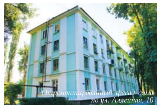
Отремонтированный фасад дома по ул. Аллейная, 10

– Уже с весны мы стали приобретать необходимые расходные материалы для подготовки к