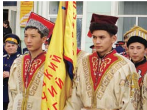
Делегация Калмыкии на казачьем войсковом смотре в городе Новочеркасске