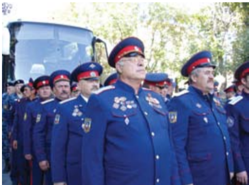
Казаки с миссией в Южной Осетии

12 июня Всевеликое войско Донское провело в Новочеркасске праздничные мероприятия, посвященные празднованию Дня Святой Троицы и Дня России. Представители всех казачьих округов Войска приняли участие в церковной службе, которая состоялась в Войсковом Вознесенском кафедральном соборе и возложили цветы к памятникам и захоронениям казаков-героев. По Платовскому проспекту казаки прошли торжественным маршем города и