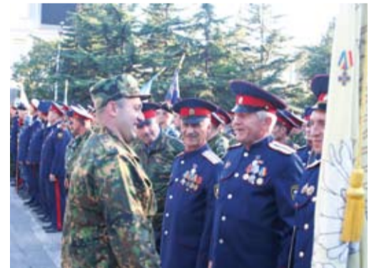
Донские казаки на Северном Кавказе